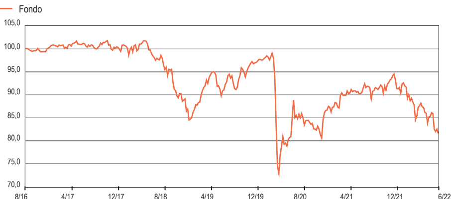
Grafico Performance ( crescita 100 ) - Da Inizio Gestione: weekly observations

www.linkfundsolutions.lu ( info@linkfundsolutions.lu )