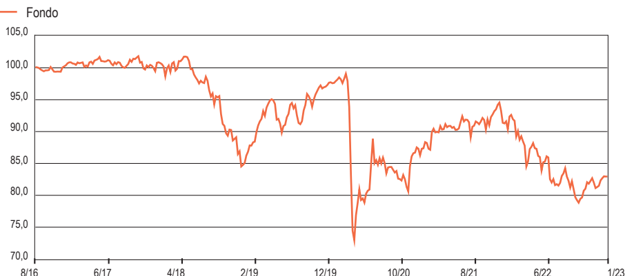
Grafico Performance ( crescita 100 ) - Da Inizio Gestione: weekly observations

www.linkfundsolutions.lu ( info@linkfundsolutions.lu )