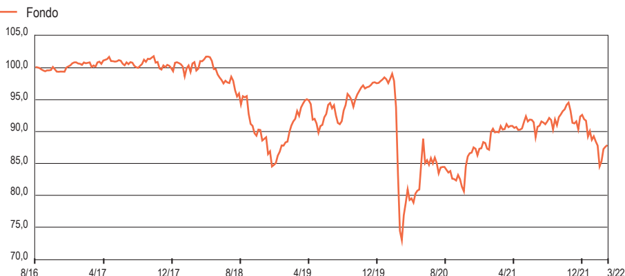
Grafico Performance ( crescita 100 ) - Da Inizio Gestione: weekly observations

www.linkfundsolutions.lu ( info@linkfundsolutions.lu )