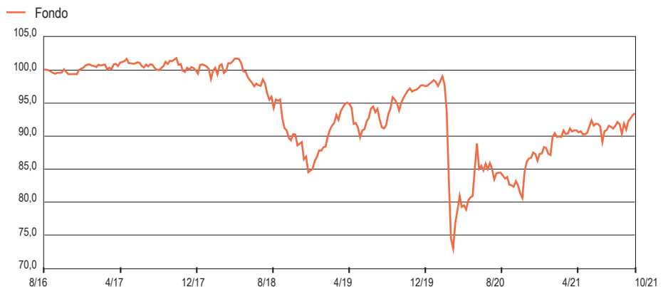
Grafico Performance ( crescita 100 ) - Da Inizio Gestione: weekly observations

www.linkfundsolutions.lu ( info@linkfundsolutions.lu )