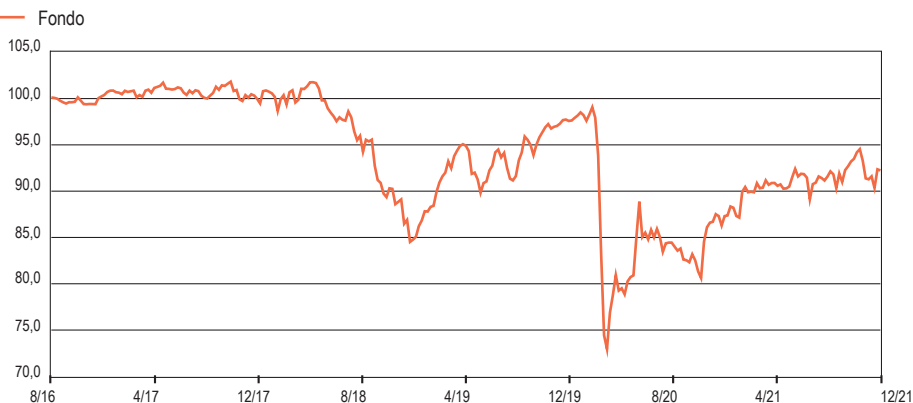
Grafico Performance ( crescita 100 ) - Da Inizio Gestione: weekly observations

www.linkfundsolutions.lu ( info@linkfundsolutions.lu )