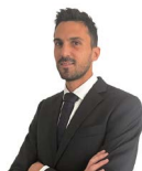
Enrico Lotto Servizi di Gestione e Consulenza